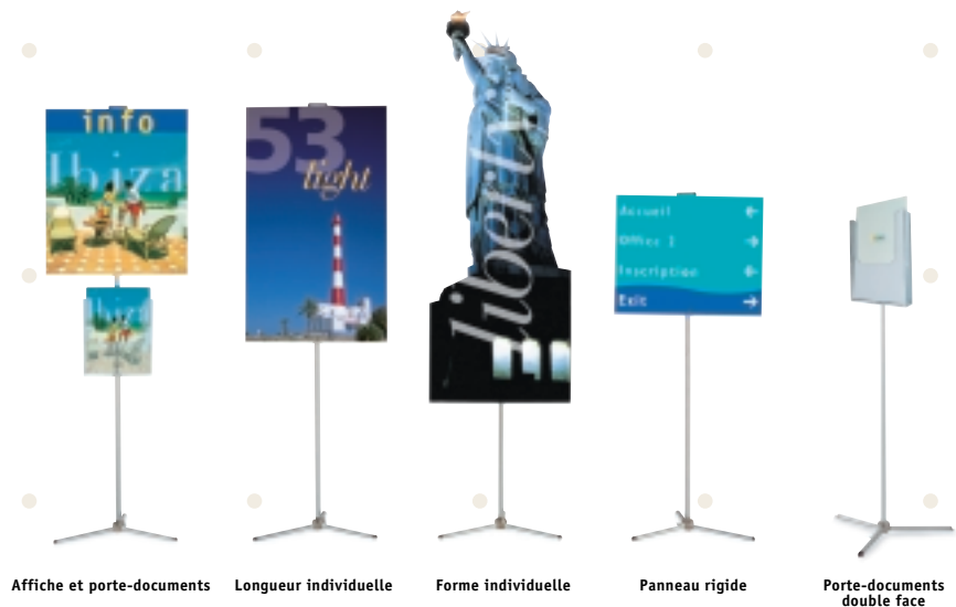
Affiche et porte-documents

duo.sprint est un support de communication parfaitement souple qui s'adapte à la nature de votre communication. Longueurs de panneaux différentes, panneaux souples ou rigides, visuel en forme individuelle, porte-documents en accessoires... et toujours une mise en œuvre simple, très simple.